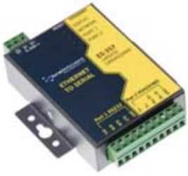
Ethernet - Soros