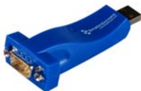
USB dla komputerów stacjonarnych