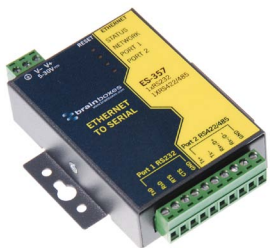
De Ethernet a En serie