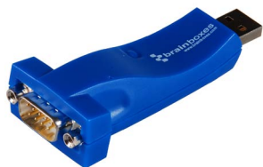
De USB a En serie - Sobremesa