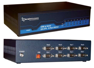
USB vers Série – Industriel