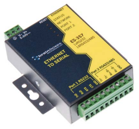
Ethernet vers Série