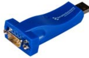
USB/seriale – Apparecchiature da ufficio