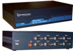
USB/seriale – Apparecchiature industriali