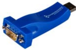
De USB a En serie - Sobremesa