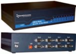
De USB a En serie - Industrial