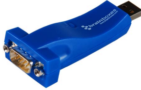
USB到串行口的连接 - 桌面应用型