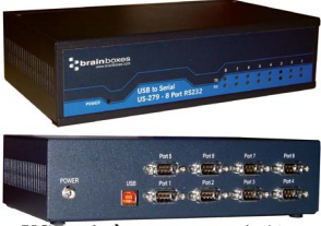
USB到串行口的连接 - 工业应用型